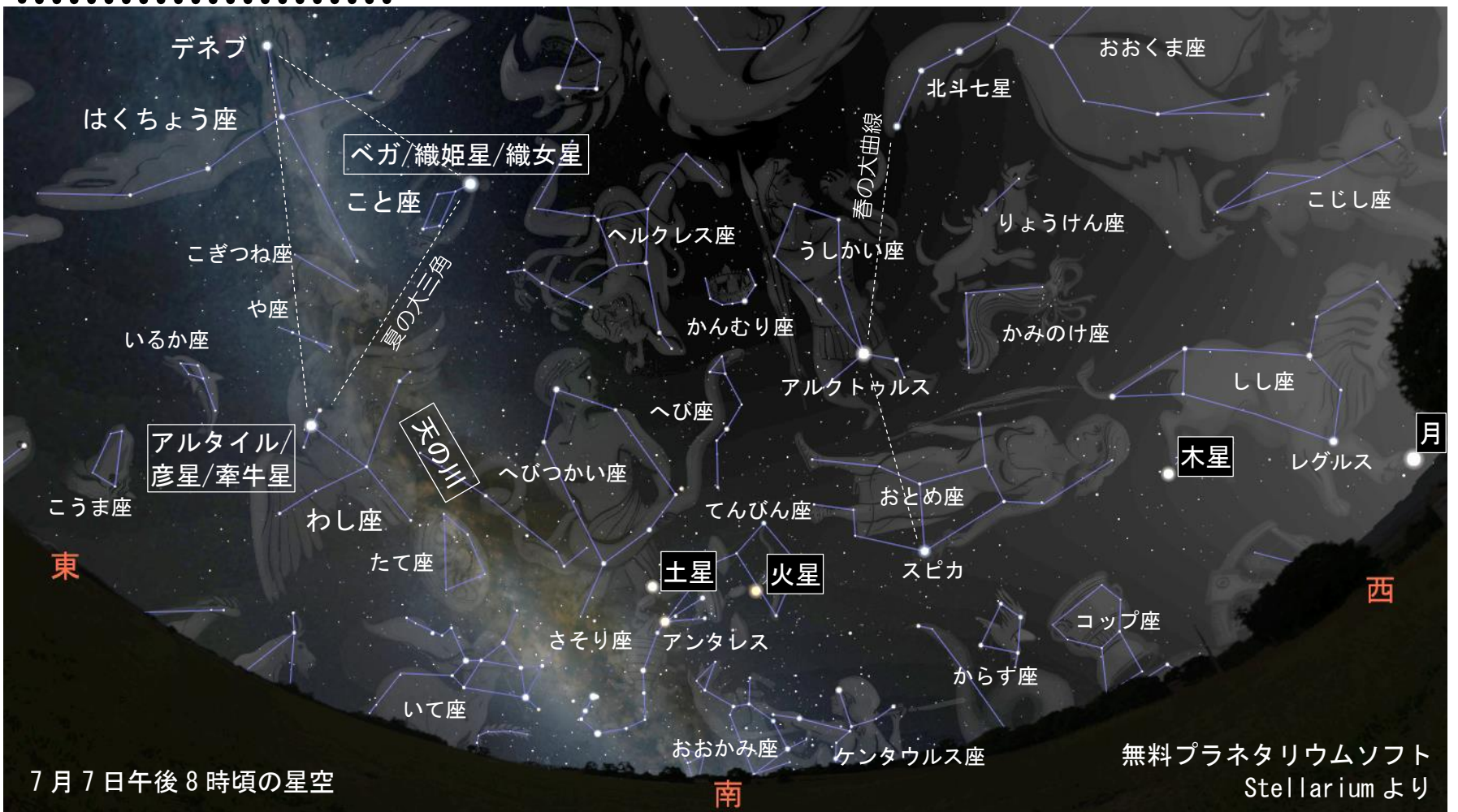
7月7日午後8時頃の星空

新暦(太陽暦)の七夕はまだ梅雨の最中で、雨や曇りが多く、星はあまり見えませんが、旧暦の七夕(今年は8月9日)頃は日本全域が太平洋高気圧に覆われ、天気も安定して星空もきれいに見られます。一か月後はこの図より 30° 全体に西に移ることに注意して、山や海など空の暗い場所で星を探してみてくださいね。