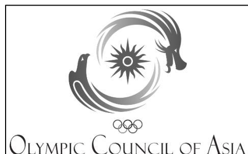
アジアオリンピック評議会のロゴ

つながるスポーツ振興施策や、アジアの平和を推進する事業は大いにやるべきだと考えます。しかし、全体経費