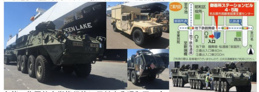
18/31 名古屋港から陸揚げされるストライカー装甲車など 15/21 県営名古屋空港に飛来したオスブレイ

主催：集团的自衛権行使に反対する昭和区の会 共催：「安保関連法」に反対する中京大学有志の会・中京大学九条の会 協賛：DemosKratia 連絡先：☎052-852-1220 (鶴舞総合法律事務所) Twitter: @peacesharing 昭和区御器所通3-18 エスティプラザ御器所4F