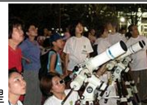
←市民観望会の様子(名古屋市科学館 web サイトより)

名古屋市科学館では、6/3(土)PM6:45～PM9時の市民観望会で、「月とならぶ木星を見る会」を行います(天候不良時はプラネタリアム)。申込受付期間は5/1(月)～5/16(火)(必着)、申し込み方法は往復はがきで下図のように記入を。詳しくは「名古屋市科学館 市民観望会」で検索してください。