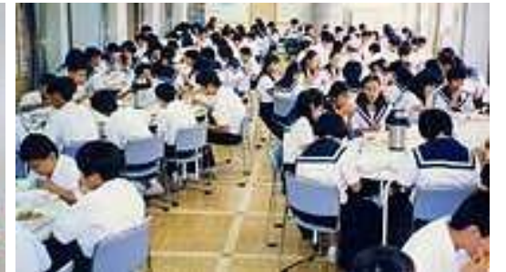
ランチルームでの昼食風景

が10℃以下に冷やされて学校に届く。栄養バランスのとれたスクールランチは重要だが、おいしくないからと残してしまうようでは、十分栄養を取ることはできない。保温食缶に入れるなど、(国基準の)65℃以上で届られないのか」と提案しました。