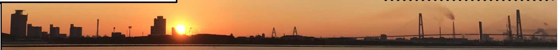
藤前干潟の初日の出(2017.1.1)