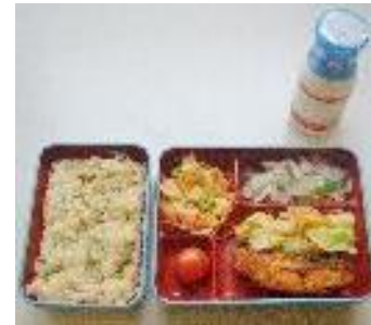
教室で食べるランチボックスの一例

「ラーメンのときは(温かいから)食べる」など、生徒たちの不満の声を紹介。「民間調理場方式のため衛生上、肉や魚の主菜