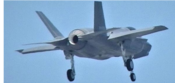
名古屋市上空を小牧基地方面に向けて飛行するF-35(2018/4/19)

た」と回答。飛行回数は昨年が6日で7回、今年は10月末までに14日で17回飛行したとの説明でした。