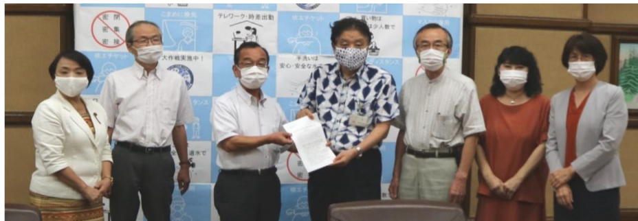
河村市長(中央)に申し入れ書を手渡す、日本共産党の岩中党県委員長(左から2人目)と党市議団=4日、市役所