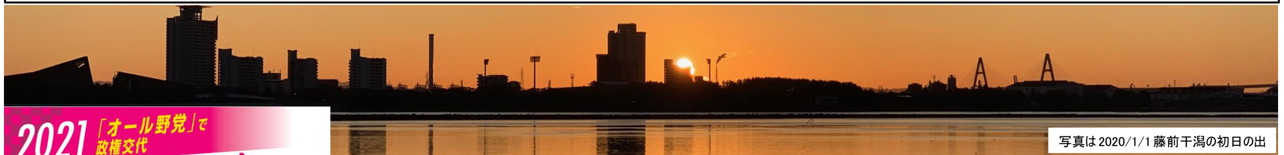
写真は2020/1/1 藤前干潟の初日の出