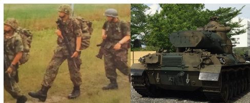
(左) 昨年の徒歩訓練

迷彩服を着て銃をかついで庄内川、矢田川河川敷、周辺市街地を126名の隊員が5月21日に徒步行進訓練を行うことを受けての申し入れです。