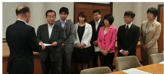
市長秘書に要望書を手渡す市議団

そして、守山自衛隊駐屯地の門前で、申し入れ文書を手渡しました。市議団として、陸上自衛隊第10師団に徒歩訓練の中止の申し入れをしたのは、初めてです。