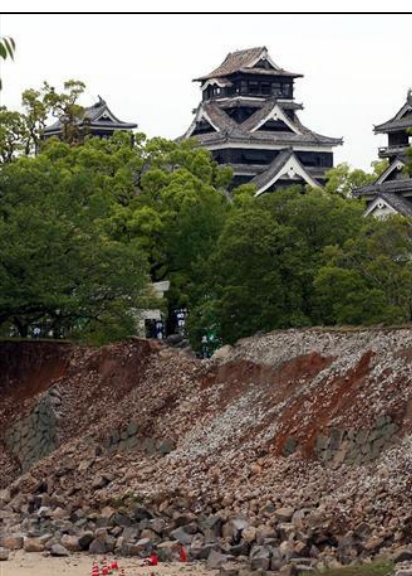
崩れた石垣と損傷の激しい熊本城天守閣