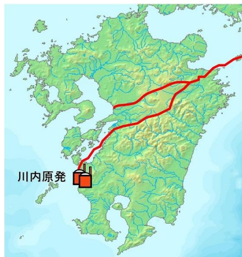
日本を縦断する最大の活断層・中央構造線

震源域が九州横断的に拡大しており、この地震が今後どのように広がるかは予測がつかない。新幹線や高速道路が不通であり、万が一事故が起きた場合に、避難に重大な支障が生まれることは明らかである。電力需要からみても、