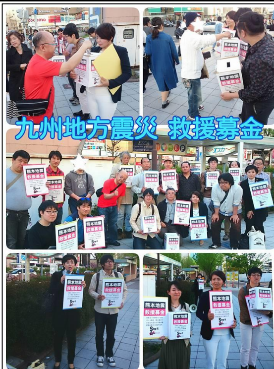
4/17 デモを中止して募金に取り組む若者ら

また、10万人を超える方が困難な避難生活を送っています。避難所では、現地での情報収集・物資配送の体制が不足している状況で、各地で食料や水などが十分行き渡っていないことが報道されています。また一回目の地震の後、雨が予想されたため屋内で過ごしていたことが、本震で倒壊した家屋の下敷きになるなどの多くの犠牲を出し