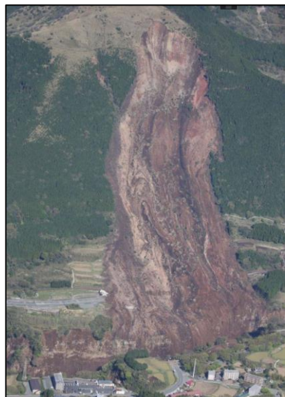
熊本県南阿蘇村 地震で起きた大規模な土砂崩れ