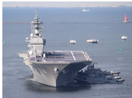
ヘリ搭載護衛艦いずも (Wikipedia より)

との情報を受け、山口議員と柴田議員で、サミット警護の名目で、名古屋港をなし崩しに軍事利用させて良いのか、と名古屋港管理組合に対し申し入れを行いました。