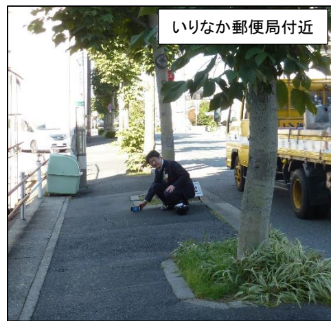
いりなか郵便局付近

隼人町信号を超えて南西に進むと(地図)、歩道の傾斜はほとんどありませんが、舗装の荒れが目立ちます。おそらく数十年前にブロック状のコンクリート