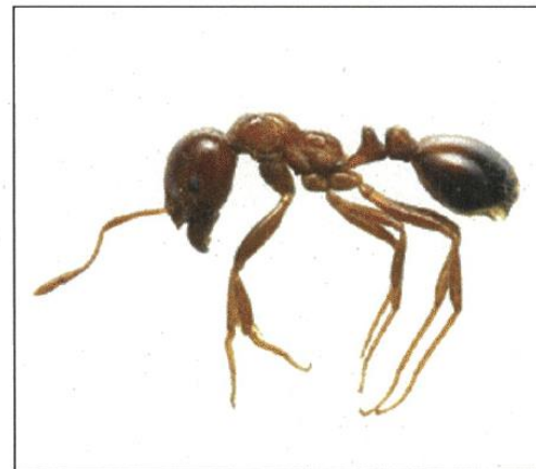
全体は赤茶色で腹部が黒っぽい赤色