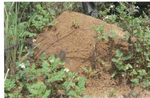
土で作られるドーム状のヒアリの巣(アリ塚)