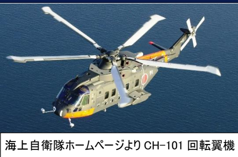
CH-101 回転翼機

党市議団として、安全管理に万全を期すこと（艦載ヘリ CH-101 は岩国基地で横転事故を起