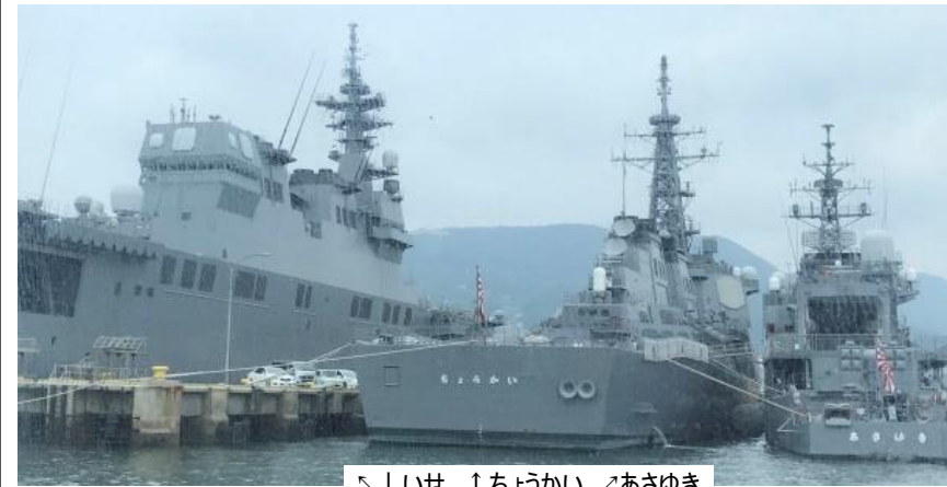
↑いせ ↓ちようかい ↗あさゆき

観光船で佐世保港湾内を一回りしました。船着場を離れるとすぐに、護衛艦「あさゆき」「あけぼの」「ありあけ」、イージスシステムを搭載した護