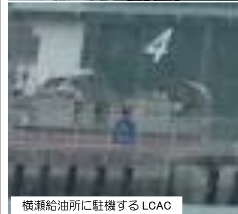
横瀬給油所に駐機するLCAC