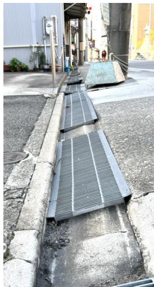
弁天前バス停付近の危険なL字溝と不安定なバス停(奥)

川原神社前の、弁天前バス停栄方面付近。路肩の私道の入り口に当たる部分に住民の方が善意で置かれたグレーチング（金網状のふた）が、かえってつまずきやすい危険な状態になっている問題は、そもそもL字溝が地面と整合していない（深すぎる）ため、段差が大きいことが原因でした。