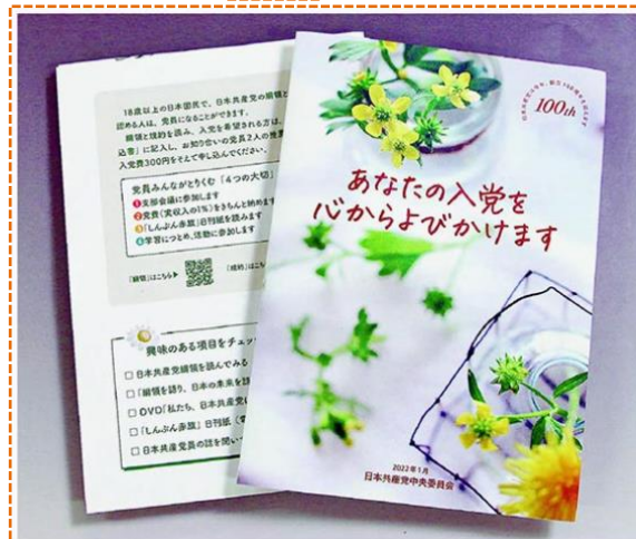
日本共産党の新しい「入党のよびかけ」できました