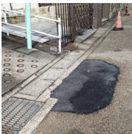
さっそく一部補修された八事霊園近くの舗装

また、八事霊園近くの砂利が浮いた舗装の改善については、来年度の予算要求に入れて、再来年度には全面舗装が実現する予定ですが、深くえぐれていた部分が、さっそく補修されていました。