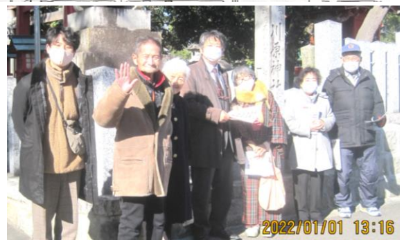
1/1 川原神社前での元旦宣伝の様子