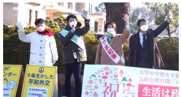
1/9(日)公会堂前で新成人に訴える、左からもとむら伸子衆院議員、たけだ良介参院議員、すやま初美参院予定候補、柴田民雄前名古屋市議ら