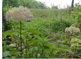
咲き始めたあじさい (東山テニスコート)