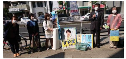
いりなか駅前朝宣伝