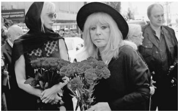
ロシアの歌手の葬儀に参列したプガチョワ氏—2018年9月、モスクワ