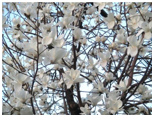
街路樹のこぶしの花