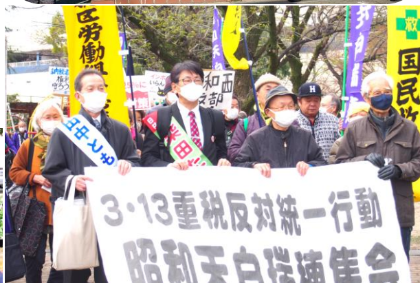
高辻公園から昭和税務署まで消費税引き下げ、インボイス制度反対、マイナンバーカード強制反対を訴えデモ行進