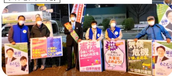
シャンピアポート前