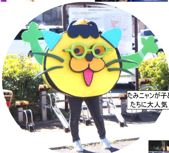
たみニャンが子どもたちに大人気！