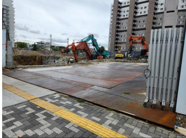
6/9の西友解体工事現場の様子。開口部の門扉が開け放たれたまま、守衛も立てずに工事が行われている。

解体工事が進んでいる西友跡地(塩付通3-1)ですが、市民の方から、「北側の開口部分のフェンスが開けっぱなしで、守衛も立てずに工事を行なっているが、どうなっているのか!」と通報がありました。その都度、市監督当局に連絡し、その後一旦は改善されま