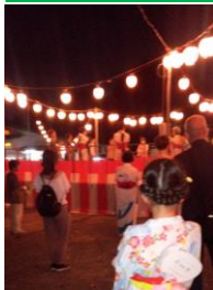
盆踊り大会(Yさん撮影)

8月19日(土)、川原神社の盆踊り大会が3年ぶりに行われ、お年寄りから若い親子連れ多くの人で賑わいました。学区主催なので、業者の屋台は無く、女性会など、地元の知り合いがお店を出していて、安心です。65歳以上の参加者には、天然水のサービスもありました。8時半まで、3重位の輪が切れませんでした。(広路学区 Yさん)