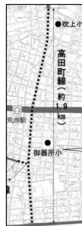
廃止された高田町線(昭和区部分)計画図

2004年名古屋市は、昭和区吹上町から瑞穂区高田町にかけて約4キロにわたる都市計画道路「高田町線整備計画」をぶち上げました。戦後直後の1946年に建てた計画が幽霊のごとく58年後にわきでてきたのです。住宅密集地を南北ほぼ一直線に貫く計画で住宅の移転用地買収対象件数約300軒、総事業費135億円の道路整備です。吹上支部・後援会の仲間たちは、2006年「高田町線を考える会」(以下「会」)を立ち上げ、10年間におよぶ建設反対運動をスタートしました。「会」は、タウンウォッチングを開催し、不安を抱える地域の住民の声を丁寧に集め、市に建設撤回を求める運動を展開。対して市当局は、「計画ありき」の態度で、住