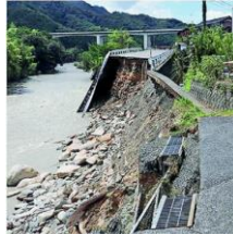
鳥取県市用瀬町の国道482号(赤旗8/17付より)

連日の暑さに、台風時の雨の激しい降り方に気候の変化を感じずにはられませんね。鳥取では台風7号が2日間で3か月分の雨を降らせ被害甚大でした。一方、新潟などでは1か月以上雨が降らず、米づくりが危機に。農家の方が来年の米の苗の買い付けには、「借金しないといけない」と嘆いていました。地球温暖化による高い気温と乾燥により、世界中で山火事が頻発。マウイ島の山火事で島は壊滅的な被害で死者も100人以上、カナダ、スペイン、ポルトガル、ギリシャ、フランスなど世界で1日1,000カ所以上発生。森林の消失、住居の消失と住民の避難が続いています。森林の消失がCO 2 の吸収量を減少させるなど負のスパイラルが。