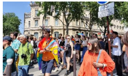
パリ・プライドマーチの様子