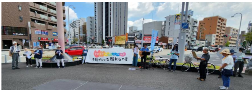
平和がいいな昭和区の会スタンディングアピール(8/19)みんなで「へいわのうた」を歌っていきます