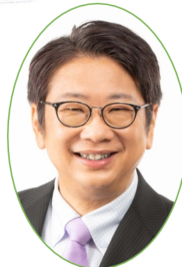
柴田民雄 元名古屋市議会議員