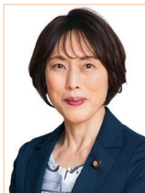
田村智子新委員長

その後中央役員などを選挙し、中央委員会議長に志位和夫氏、幹部会委員長に田村智子氏が決定しました。マスコミも注目しました。