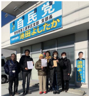
要望書を届ける市民アクション@3区の皆さん

議員は「裏金は文化だ」などと発言。であれば相当長期間かつ広範囲に裏金を受け取っている