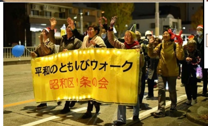
デモ行進する参加者＝8日、名古屋市内